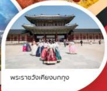
พระราชวังเคียงบกุง