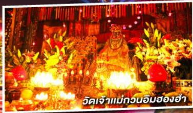
วัดเจ้าแม่กวนอิมฮ่องอ๋า