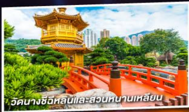
วัดนางชีวิหลินและสวนหนานเหลียน