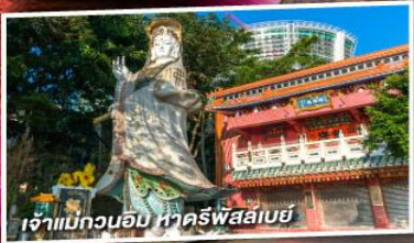
เจ้าแม่กวนอิม หาดริฟัสสเบย