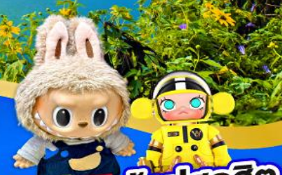
POP MART ช้อปปิ้งสุดฮิต

เมนูพิเศษ! ชาบู บุฟเฟ่ต์ ปลาประธารานริบคิ Seafood สไตล์ไต้หวัน