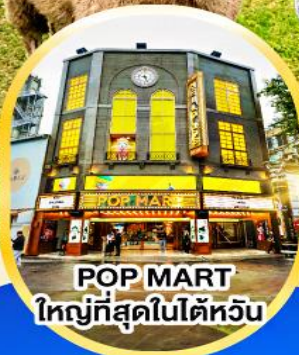
POP MART ใหญ่ที่สุดในไต้หวัน