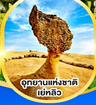
อุทยานแห่งชาติ เย่หลิว