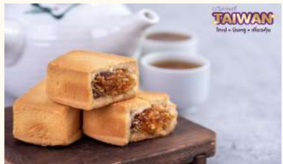
TAIWAN Inn • Song • Taiwan

📍บริการอาหารเช้า ณ ห้องอาหารของโรงแรม เดินทางสู่เมืองไทเป (ใช้เวลาเดินทางประมาณ 2 ชั่วโมง) นำท่านแวะชม ร้านขนมพายสับปะรด ร้านนี้เป็นร้านซึ่งได้รับการรับรองคุณภาพจากการท่องเที่ยวแห่งประเทศไทยได้ทุกวัน และ ราคาเยี่ยมเยาปลอดภัยสินค้าแนะนำได้แก่ ขนมพายสับปะรด ขนมพายเผือก ขนมพายช็อคโกแลตไส้เกาลัด หมูแผ่น ข้าวตังสาหร่าย ขนมโมจิรสชา ฯลฯ จากนั้น เดินทางสู่ เมืองนิวไทเป