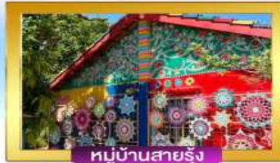
หมู่บ้านสายรุ้ง