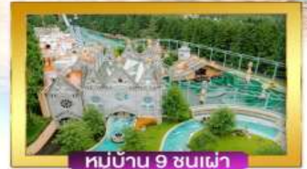
หมู่บ้าน 9 ขนเฝ้า