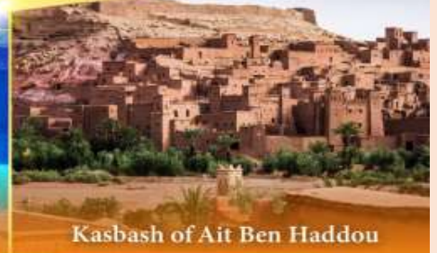
Kasbah of Ait Ben Haddou