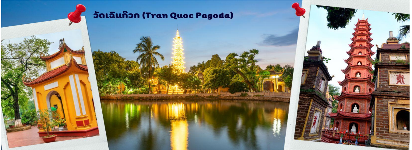
วัดเจินกิวก (Tran Quoc Pagoda)

ผั่งเป็นอย่างดี ใช้สีสันทึ่กลมกลืนในโทนสีเหลือง น้ำตาล ตัดกับสีเขียวของต้นไม้ใหญ่ที่โอบล้อมอยู่ในมุมถ่ายภาพจากอีกฝั่งหนึ่ง จะเห็นสิ่งปลูกสร้างสไตล์จีน และเจดีย์หลายชั้นโดดเด่น มีภาพที่สะท้อนลงสู่ผิวน้ำ เป็นภูมิทัศน์ที่งดงามทั้งยามกลางวันและยามค่ำคืนที่มีการเปิดไฟส่องสว่าง