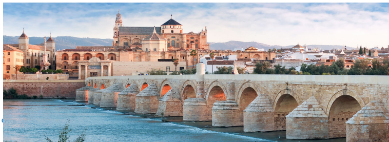
Spain & Portugal 10D7N , SV / C

นำท่านชมเมืองคอร์โดบา Cordoba เมืองที่สวยงามในแบบมูเดก้าและเป็นเมืองที่เจริญรุ่งเรืองที่สุดในยุคที่ มัวร์ปกครอง นำท่านชมย่านเมืองเก่าที่ยังคงมีสถาปัตยกรรมน่าประทับใจหลายแห่งที่ย้อนไปเมื่อครั้งเมืองนี้ เป็นเมืองหลวงที่เจริญรุ่งเรือง ชมสะพานโรมัน Puente Romano เป็นสะพานสำหรับการสัญจรข้ามแม่น้ำ กัวดาลกีบีร์มีอายุราว 2 พันปี โดยบริเวณเมืองเก่ายังเป็นที่ตั้งของมหาวิหารกอรีโดบา Mezquita Cathedral หรือในอดีตคือมัสยิดใหญ่แห่งกอรีโดบา The Mosque-Cathedral of Córdoba หนึ่งในมรดกโลก ชมบริเวณ ชุมชนเมืองเก่า และถ่ายรูปกับถนนดอกไม้อันเป็นสัญลักษณ์ของคอร์โดบาที่ปรากฏอยู่บนโปสการ์ดทั่วไป