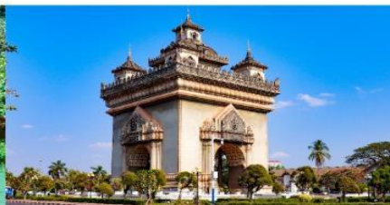
ประตูลอย