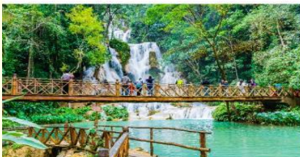
น้ำตกตาดขวางสี