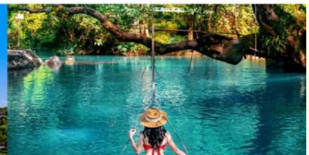
บลูลากูน

*ทางบริษัทฯ ขอสงวนสิทธิ์ในการสลับโปรแกรมทัวร์ตามความเหมาะสมขึ้นอยู่กับสถานการณ์หน้างาน โดยคำนึงถึงผลประโยชน์ของลูกค้าเป็นสำคัญ