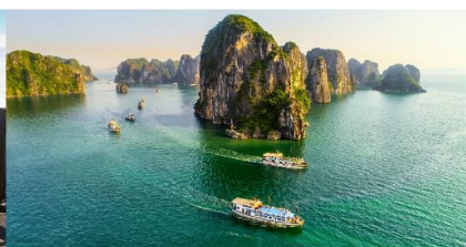
ล่องเรือชมอ่าวฮาลอง

*ทางบริษัทฯ ขอสงวนสิทธิ์ในการสลับโปรแกรมทัวร์ตามความเหมาะสมขึ้นอยู่กับสถานการณ์หน้างาน โดยคำนึงถึงผลประโยชน์ของลูกค้าเป็นสำคัญ