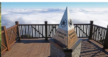
ยอดเขาฟานซิปิน