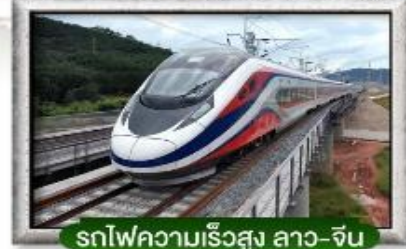
รถไฟความเร็วสูง ลาว-จีน