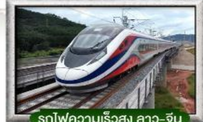
รถไฟความเร็วสูง ลาว-จีน