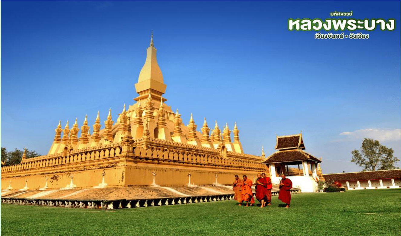
มัทศจรรย์ หลวงพระบาง เวียงจันทน์ • อังเวียง

จากนั้น เดินทางสู่สถานีรถไฟความเร็วสูง เตรียมตัวมุ่งหน้าสู่หลวงพระบาง