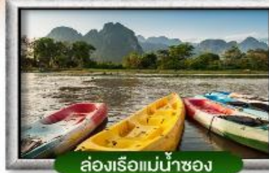
ล่องเรือแม่น้ำซอง