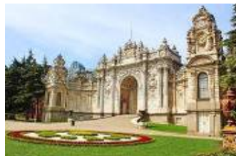
พระราชวังโดลมาบาเซ่