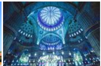
มัสยิดสีน้ำเงิน