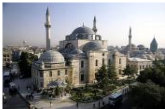
เมืองคอนย่า