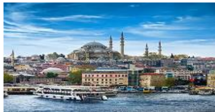
ล่องเรือช่องแคบบอสฟอรัส