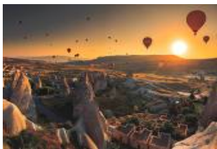
เมืองคัปปาโดเกีย