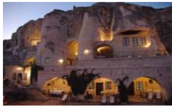
โรงแรมถ้ำ