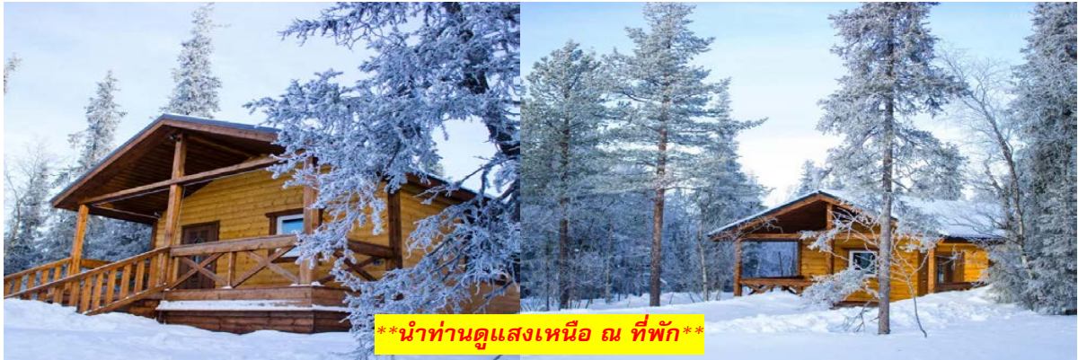
**นำท่านดูแสงเหนือ ณ ที่พัก**

*** การพบเห็นปรากฏการณ์แสงเหนือ เป็นปรากฏการณ์ทางธรรมชาติ ไม่สามารถกำหนดหรือทราบล่วงหน้าได้ โอกาสที่จะได้เห็นขึ้นอยู่กับสภาพอากาศเป็นสำคัญ โดยช่วงปลายฤดูใบไม้ร่วงจนถึงต้นฤดูใบไม้ผลิ ในเดือน ตุลาคม กุมภาพันธ์ และ มีนาคม เป็นเดือนที่เหมาะสมสำหรับการชมออโรราทางซีกโลกเหนือ มักจะเกิดในช่วงเวลา สี่ทุ่มจนถึงเที่ยงคืน และ โปรแกรมอาจมีการปรับเปลี่ยนได้ตามความเหมาะสม***