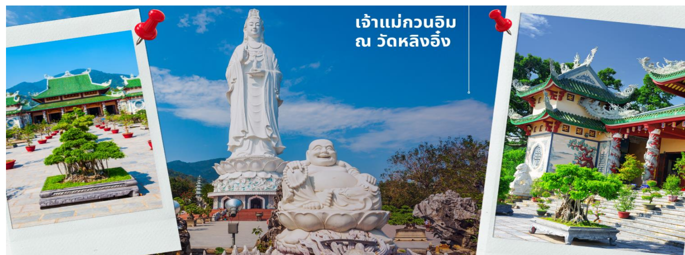
เจ้าแม่กวนอิม ณ วัดหลิงอิ่ง

เช้า รับประทานอาหารเช้า ที่ โรงแรม (2) นำท่านมีสการองค์ เจ้าแม่กวนอิม ณ วัดหลิงอิ่ง อยู่บนเกาะเซินตรา (Son Tra) ทางเหนือของเมืองดานัง เป็นวัดใหญ่ที่สุดของที่นี่ รูปปั้นปูนขาวของเจ้าแม่กวนอิมยืนหันหลังให้ภูเขา หันหน้าออกสู่ทะเลเพื่อเป็นการปกป้องคุ้มครองชาวประมงที่ออกไปหาปลา เสียงระฆังวัดที่ตีประสานกับเสียงคลื่นนั้นช่วยให้ชาวเรือรู้สึกสงบ