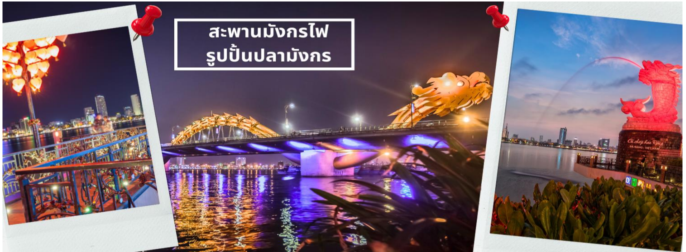
สะพานมังกรไฟ รูปปั้นปลามังกร

จากนั้นนำท่านชม สะพานแห่งความรัก ที่นิยมของหนุ่มสาวคู่รักกันมาซื้อกุญแจใส่คล้องใส่สะพาน จากนั้นนำท่านชม รูปปั้นปลามังกร ที่เป็นสัญลักษณ์ของเมืองดานัง เมืองที่กำลังจากปลากลายเป็นมังกรในระยะใกล้ เชิญท่านเพลิดเพลินกับความอลังการของ สะพานมังกรไฟ ที่มีความยาวถึง 666 เมตร เป็นสะพาน 6 เลนส์ ซึ่งเป็นสะพานที่ตระการตามากที่สุดของเวียดนามในเวลานี้โดยการแสดงนี้จะเริ่มเวลา 21.00น. ของวันเสาร์และอาทิตย์เท่านั้น