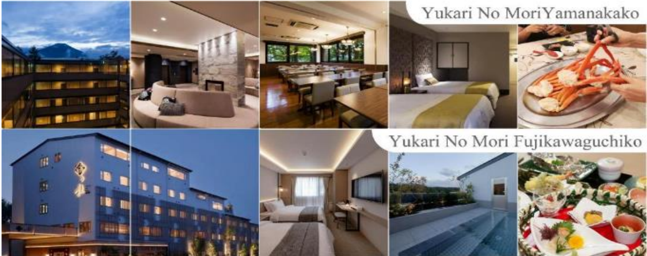
Yukari No Mori Yamanakako

YUKARI NO MORI, YAMANAKAKO หรือระดับเดียวกัน รับประกันอาหารค่ำ ณ ภัตตาคาร ของโรงแรม (4) พิเศษ!! อิ่มอร่อยกับ บุฟเฟ่ต์ซาซู หลังอาหารให้ท่านได้ผ่อนคลายกับการแช่น้ำแร่ธรรมชาติ เชื่อว่าถ้าได้แช่น้ำแร่แล้ว จะทำให้ผิวพรรณสวยงามและช่วยให้ระบบหมุนเวียนโลหิตดีขึ้น 🍣