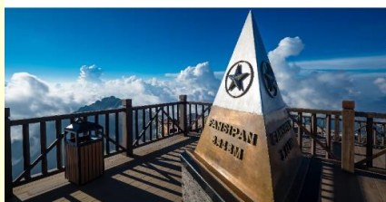
ยอดเขาฟานซิปิน