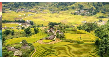
หมู่บ้านต้าฟาน

*กรณีห้องพักรับรองเปลี่ยนได้ ขอสงวนสิทธิ์ในการเปลี่ยนวันเข้าพัก และปรับเปลี่ยนโปรแกรมโดยคำนึงถึงผลประโยชน์ลูกค้าเป็นสำคัญ