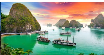
ล่องเรือชมอ่าวฮาลอง