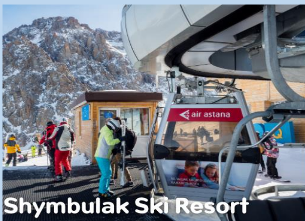
Shymbulak Ski Resort

รวมค่าขึ้นกระเช้าแล้ว(ค่าอุปกรณ์และบริการของกิจกรรมต่าง ๆ นอกเหนือจากกระเช้า ไม่ได้รวมอยู่ในค่าทัวร์สามารถสอบถามเพิ่มเติมจากหัวหน้าทัวร์ได้)