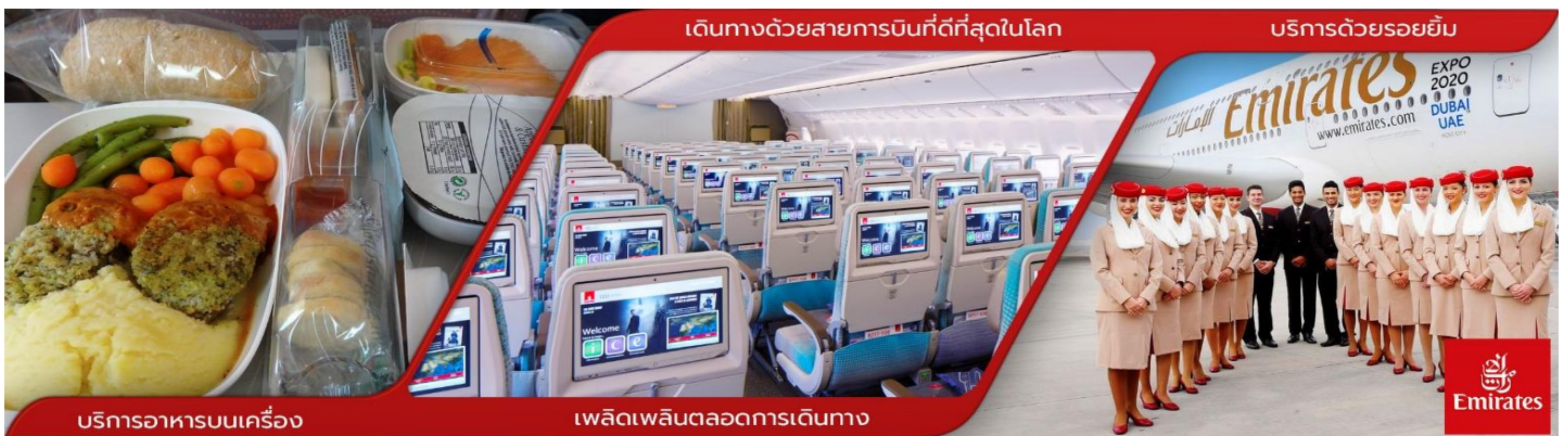
เดินทางด้วยสายการบินที่ดีที่สุดในโลก

04.45 น. เดินทางถึง สนามบินนานาชาติดูไบ ประเทศสหรัฐอาหรับเอมิเรตส์ เพื่อแวะเปลี่ยนเครื่อง