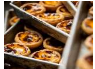
Photo stop around Macau Tower

ร้านขนม Tart ไข่ ร้านขายทาร์ตไข่ชื่อดังที่สุดเจ้าหนึ่งของมาเก๊า ด้วยการที่รสชาติใหม่ๆ แป้งบางกรอบและมีไส้ทาร์ตที่นุ่มและหวานกำลังดี จึงทำให้มีชื่อเสียงโด่งดัง