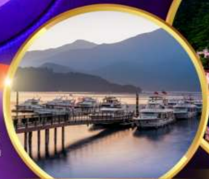
ล่องเรือทะเลสาบสุริยอันจินตรา