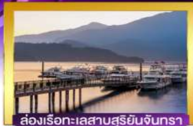
ส่องเรือทะเลสาบสุริยันจันทรา