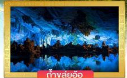
ถ้ำสุ่ยอ้อ