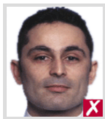
โกเลินไป