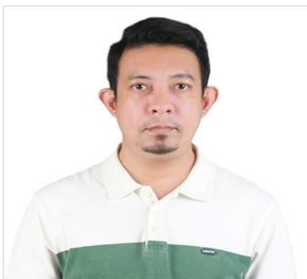
( ตัวอย่างรูปถ่าย )