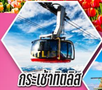
กระเช้าที่ตลีส