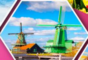
หมู่บ้านกังหันลม ชาสคินส์