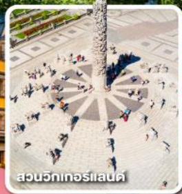
สวนจัทเทอร์แลนด์