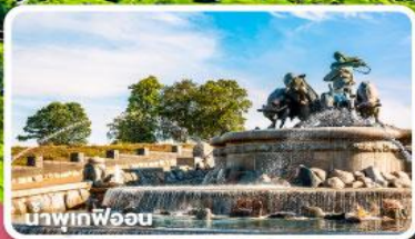
น้ำพุทฟ็อน