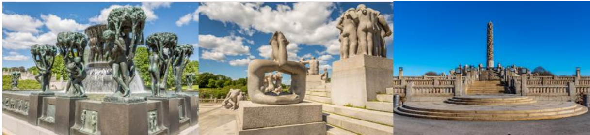
GO3ARN-EK004 Scandinavia เรือสำราญบานุกุ้ยและรถไฟสายโรเมนติก S-N-D 8D5N-EK Oct2024-May2025 Page | 4

เช้า รับประทานอาหารเช้า ณ ห้องอาหารของโรงแรม ออกเดินทางสู่ กรุงออสโล (Oslo) ประเทศนอร์เวย์ (Norway) ซึ่งเป็นเมืองหลวงที่มีค่าครองชีพสูงที่สุดในโลกแทนที่โตเกียว ออสโลตั้งอยู่ขอบด้านเหนือของอ่าวฟยอร์ด ระหว่างเส้นทางท่านจะได้พบกับสภาพธรรมชาติที่แปลกใหม่ ซึ่งเป็นธรรมชาติที่อุดมสมบูรณ์ เข้าชมอุทยานฟรอกเนอร์ (Frogner Sculpture Park) ชมผลงานของปฏิมากรเอกชาวนอร์เวย์ชื่อกุสตาฟ วิกเกแลนด์ ที่ใช้เวลา 40 ปีในการแกะกลุ่มรูปสลักหินแกรนิต และทองแดงให้คนรุ่นหลังได้เห็นวัฏจักรในหนึ่งชีวิตของมนุษย์ ตรงใจกลางของอุทยานเป็นที่ตั้งของรูปแกะสลักชิ้นโบว์แดงของท่านชื่อ "โมนอลิท" (สูง 17 เมตร) แกะจากหินสลักแกรนิตเพียงแท่งเดียว