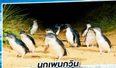
นกเพนกวิน