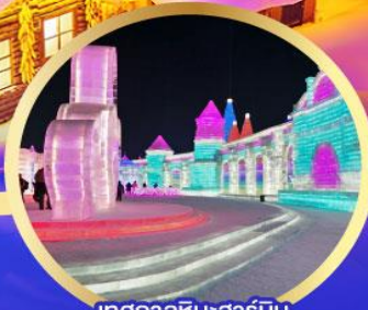
เทศกาลหิมะฮาร์บิน