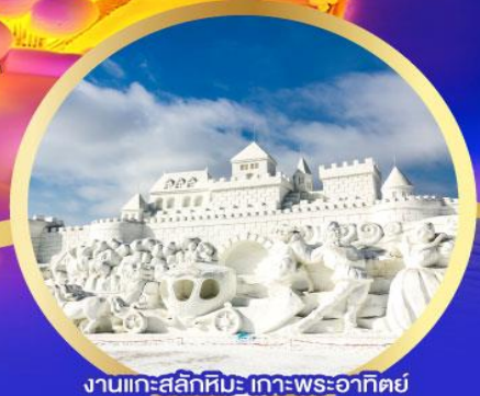
งานแกะสลักหิมะ เกาะพระอาทิตย์