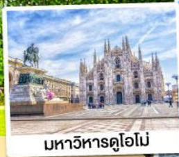
มหาวิหารคูโอโม