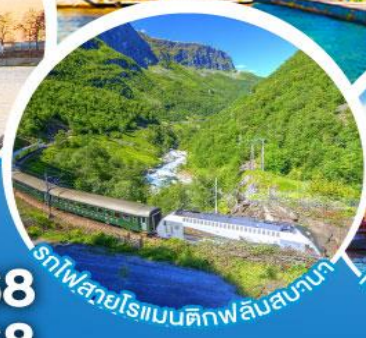
รถไฟสายโรเมนติกฟลัมสบานา