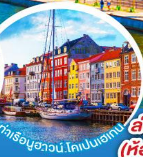
ท่าเรืออวาน์.ไทเปเนอเกน