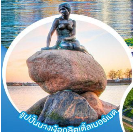
รูปปั้นนางเงือกลิตเติ้ลมอร์เนด