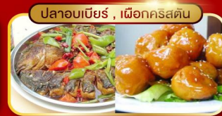
ปลาอบเบียร์, เผือกคริสตัง