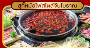
สุกี้หม้อไฟสไตล์จีนโบราณ