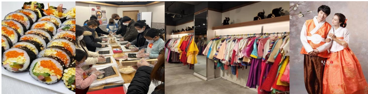
อาหารกลางวัน (4)

นำท่านไปชม โรงงานสาหร่ายเกาหลี ให้ท่านได้ชมกรรมวิธีในการผลิตสาหร่ายเกาหลีแสนอร่อย พร้อมชิมสาหร่ายๆ หรือจะเลือกซื้อเป็นของฝากกลับบ้านก็ได้ จากนั้นพาท่านไปสวายหล่อแบบหนุ่มสาวเกาหลี กับการสวมชุดประจำชาติเกาหลี “ ชุดฮันบก ” ให้ท่านได้ถ่ายรูปตามอัธยาศัย จากนั้นนำท่านไปเรียนรู้เกี่ยวกับการ ทำคิมบับ (ข้าวห่อสาหร่าย) อาหารง่ายๆ ที่คนเกาหลีนิยมรับประทาน “คิม” แปลว่า สาหร่าย “บับ” แปลว่า ข้าว โดย วิธีการทำ จะห่อเป็นแท่งยาวๆ แล้วหั่นเป็นชิ้นพอดีคำ จิ้มกะโชยุ ญี่ปุ่นหรือวาซาบิก็ได้