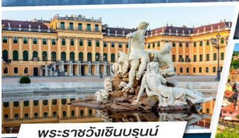
พระราชวังเซินบรุนน์