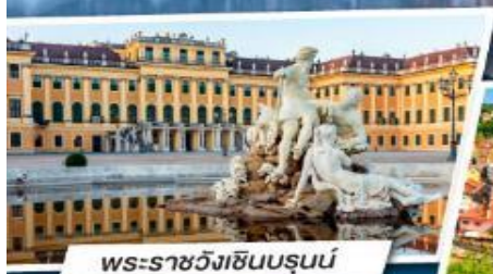
พระราชวังเซ็นบรุนน์