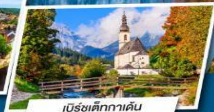
เบียร์เซดิกกาเดิน