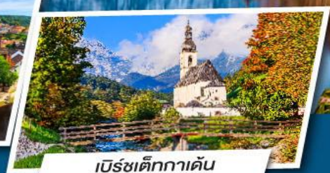
เบิร์ชเต็กกาเดิน