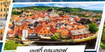
เชสกี ครุมลอฟ