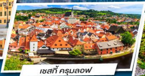
เชสกี ครุมลอฟ