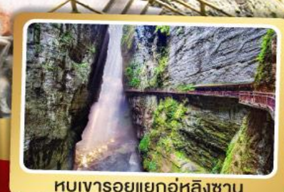
หุบเขารอยแยกอุหลิงซาน