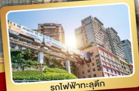
รถไฟฟ้าทะลุคิก