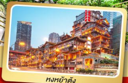
หงหย่าต้ง