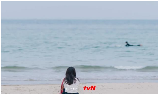
อาหารเย็น (2)

หาดวอลโป (Wolpo Beach) ฉากเปิดตัวพระเอกกับนางเอกพบกันครั้งแรก หาดวอลโปมีความยาวถึง 900 เมตร กว้าง 70 เมตร มีพื้นที่กว่า 107,786 ตารางเมตร น้ำสะอาดและดีน เหมาะสำหรับการพักผ่อน ประกอบกับเป็นชายหาดเป็นที่ที่ กระแสน้ำอุ่นและน้ำเย็นมาบรรจบกัน ทำให้มีสัตว์ทะเลมากมาย กิจกรรมที่นิยม การตกปลาหรือเล่นกระดานโต้คลื่น