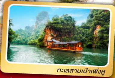
ทะเลสาบเป่าเฟิงหู