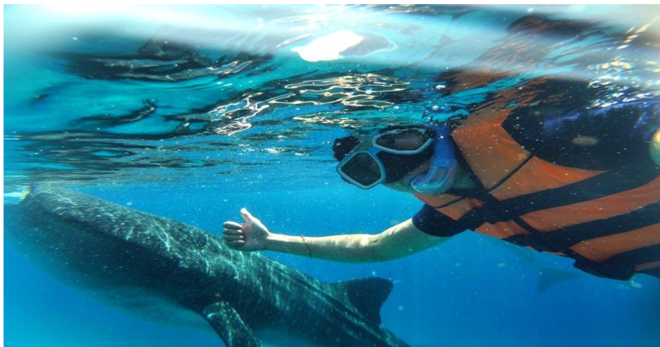
GO1CEB-PR001 - Philippines Cebu Bohol beautiful islands 5 Days 3 Nights By Philippine Airlines (PR)