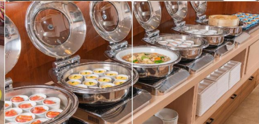
Alpico Plaza Hotel