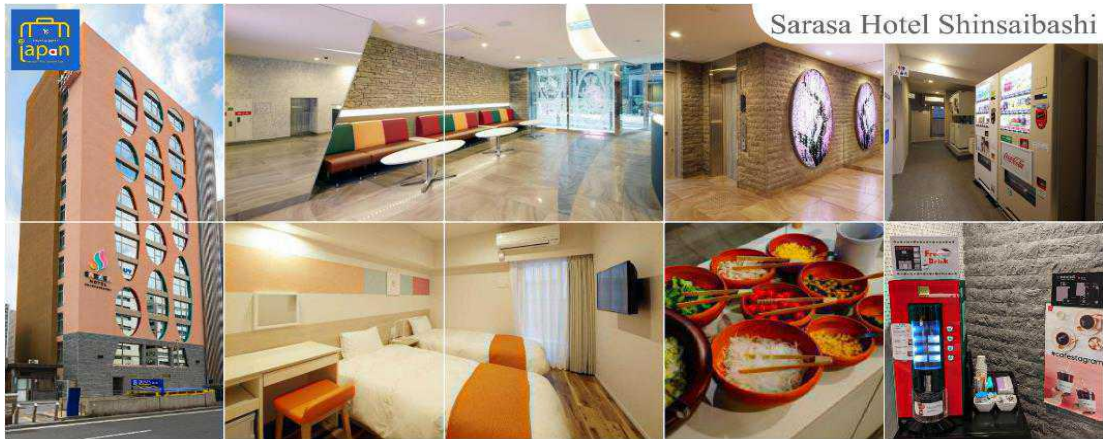
Sarasa Hotel Shinsaibashi

เย็นพักที่ อิสระรับประทานอาหารเย็นตามอัธยาศัย HOTEL SARASA SHINSAIBASHI หรือเทียบเท่าระดับเดียวกัน