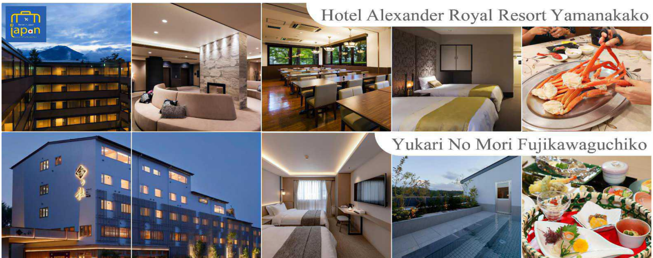
Hotel Alexander Royal Resort Yamanakako

หลังอาหารให้ท่านได้ผ่อนคลายกับการแช่น้ำแร่ธรรมชาติ เชื่อว่าถ้าได้แช่น้ำแร่แล้ว จะทำให้ผิวพรรณสวยงามและช่วยให้ระบบหมุนเวียนโลหิตดีขึ้น