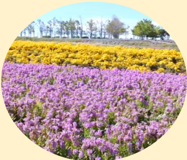
Aurora flower Graden (Golden Pyramid, Fisostegia)