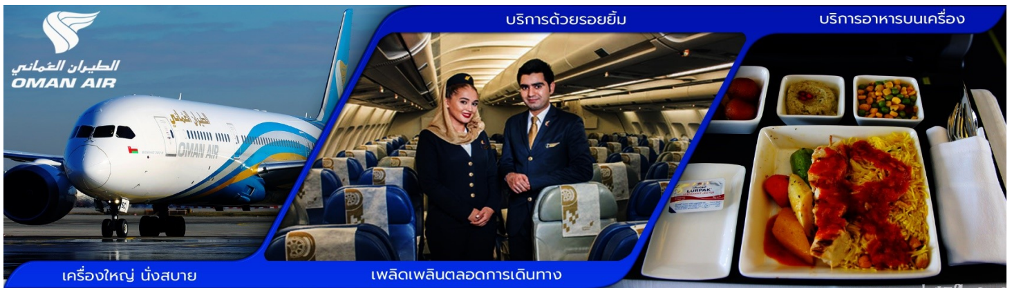
เครื่องบิน นิ่งสบาย