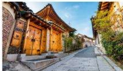
หมู่บ้านโบราณมุกซอน