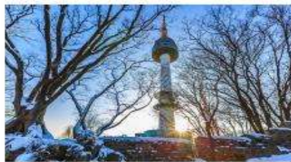
โซทาวเวอร์