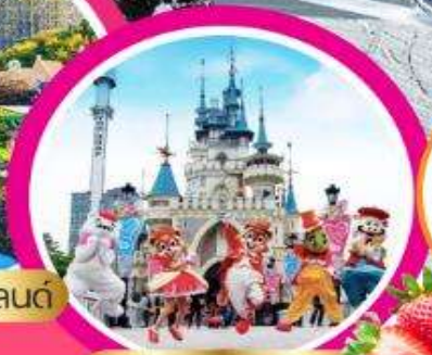
ล็อตเตเวิลด์