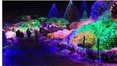
ชมเทศกาลประดับไฟฤดูหนาว