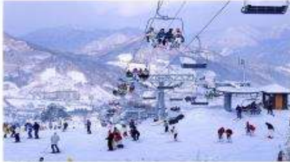
กิจกรรมลานสกี