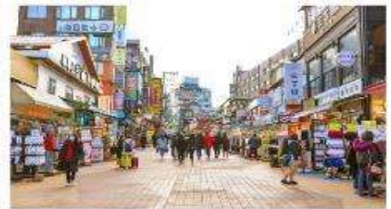
ย่านฮงแด