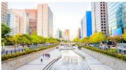
คลองชองเกซอน