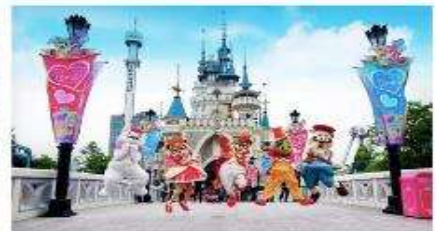
ลีดเต็วิลล์