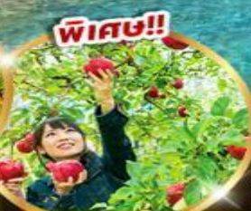
บุฟเฟต์แอปเปิ้ล

เข้าออกโตเกียว! 59,919 บาท รวมภาษีมูลค่าเพิ่ม 7%