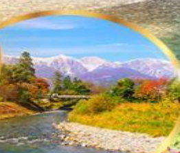
โอะอิวะ พาร์ค