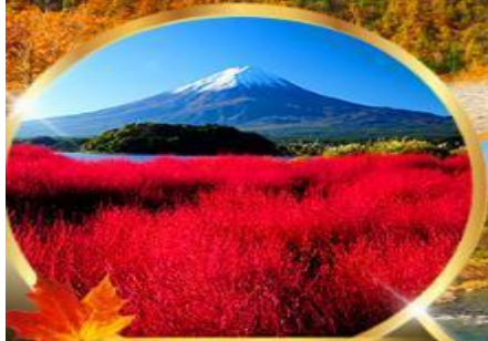
โอะอิชิ พาร์ค