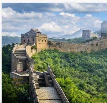
กำแพงเมืองจีน ด่านจวิหยกงวน