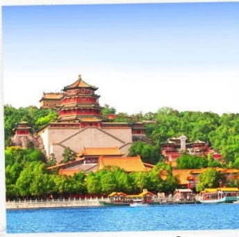
พระราชวังฤดูร้อน อวิเหอหยวน