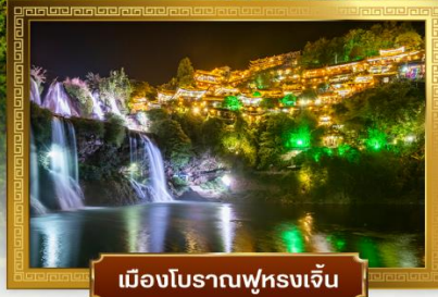
เมืองโบราณฟูหรงเจิ้น