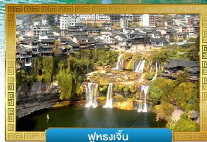
ฟูหลงจิ้น