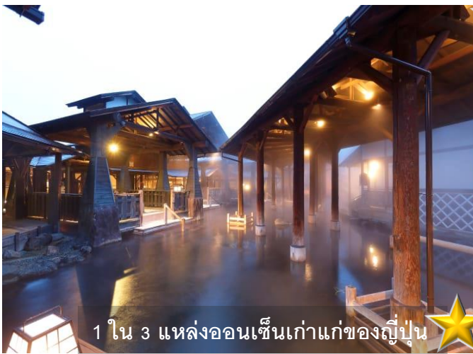
1 ใน 3 แหล่งออนเซ็นเก่าแก่ของญี่ปุ่น