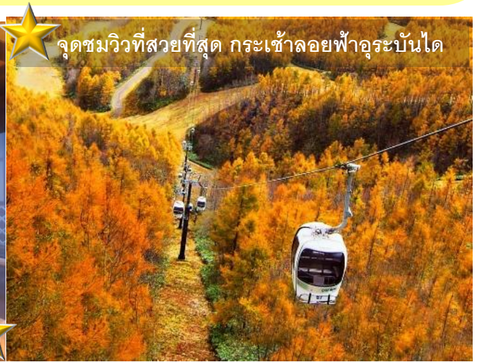
จุดชมวิวที่สวยงามที่สุด กระเช้าลอยฟ้าอุระบันได