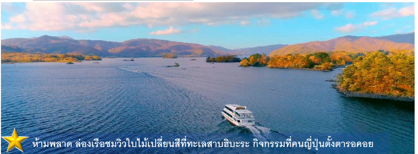
ห้ามพลาด ล่องเรือชมวิวยุโรปไม้เปลี่ยนสีที่ทะเลสาบฮิโระ กิจกรรมที่คนญี่ปุ่นตั้งตารอคอย