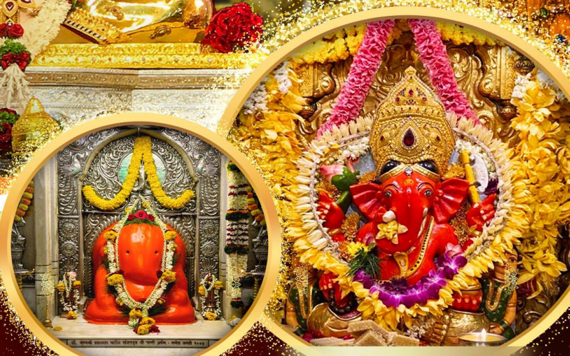
องค์อิชฎินายก