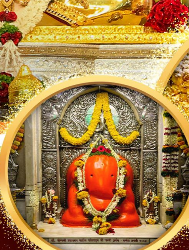
องค์อิชฎินายก