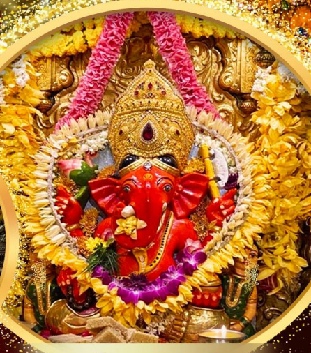
องค์สิทธินายก