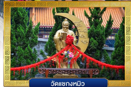
วัดแซงทมิว