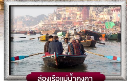
ล่องเรือแม่น้ำคงคา