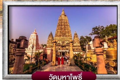
วัดมหาโพธิ์