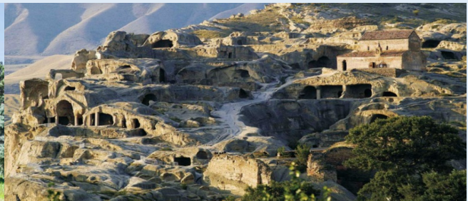
Gorgeous of Georgia!!8D5N/TK, 13-20May, 10-17Jun2023