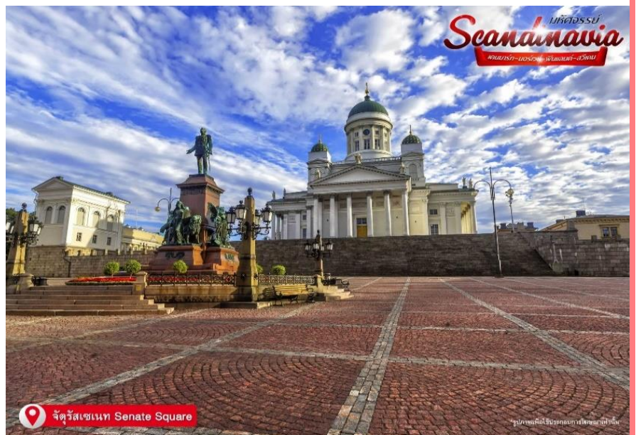
จตุรัสเซเนท Senate Square

ด้านหน้าโบสถ์มีรูปปั้นพระเจ้าอเล็กซานเดอร์ที่ 2 ที่บริเวณนั้น หอสมุดแห่งชาติเฮลซิงกิ (Helsinki Central library) หน้าอาคารภายนอกสีเหลืองเสาสีขาวและโด่งกลมตรงกลางในมุมตะวันออกเฉียงใต้ของจตุรัสคือบ้านของเซเดร์โฮล์ม ซึ่งเป็นอาคารหินที่เก่าแก่ที่สุดของเมือง